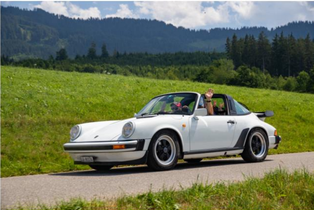
Impressionen von der Archa Ausfahrt - 2019