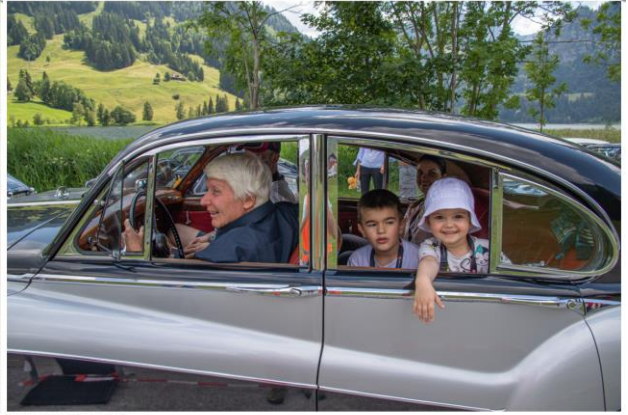
Impressionen von der Archa Ausfahrt - 2019