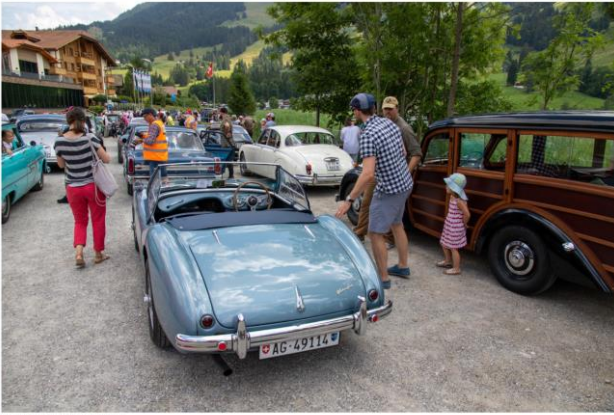
Impressionen von der Archa Ausfahrt - 2019