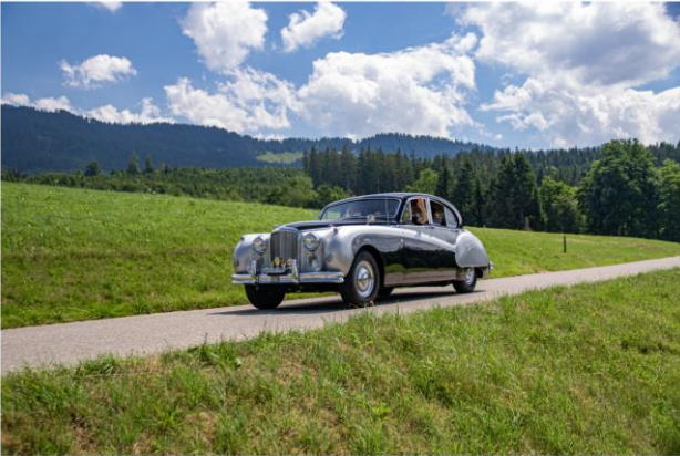
Impressionen von der Archa Ausfahrt - 2019