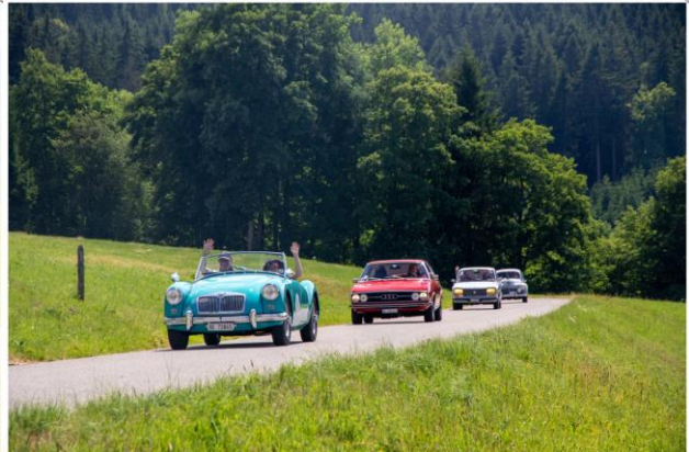
Impressionen von der Archa Ausfahrt - 2019