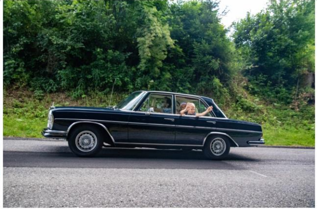
Impressionen von der Archa Ausfahrt - 2019