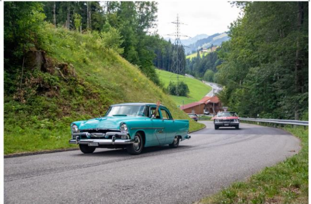
Impressionen von der Archa Ausfahrt - 2019