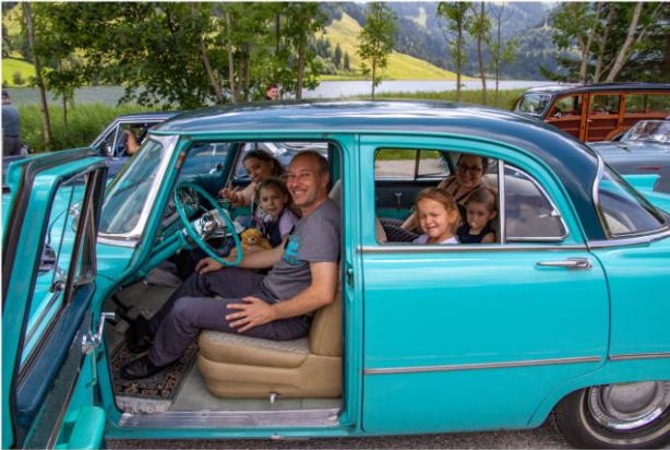
Impressionen von der Archa Ausfahrt - 2019